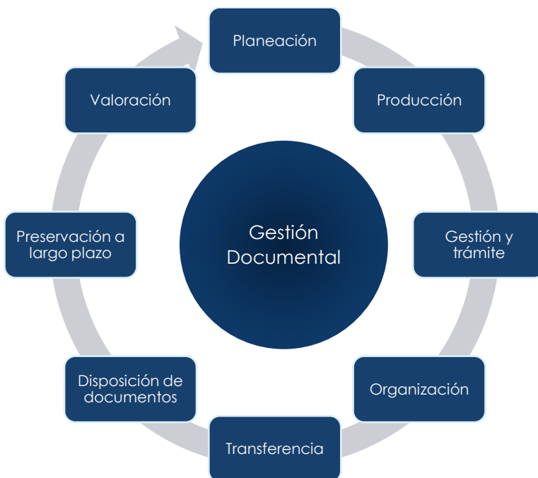
Ilustración 1 Procesos de la gestión documental

Para cada proceso se definirá los lineamientos y actividades de corto, mediano y largo plazo que permitirán implementar un modelo de gestión documental estandarizado en la Rama Judicial y darán cumplimiento a requerimientos de tipo administrativo, legal, funcional o tecnológico.